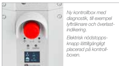
Ny kontrollbox med diagnostik, till exempel lyfträknare och överlast-indikering. Elektrisk nödstoppsknapp lättillgängligt placerad på kontrollboxen.